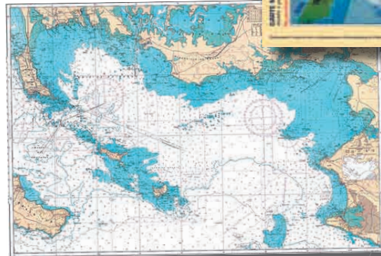
Carte Marine SHOM N° 9999 exigée pour se présenter à l'examen