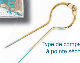
Type de compas à pointe sèche

Fournisseurs (par Internet ou à Rennes : «Librairie du Voyage» 20 rue du Capitaine Dreyfus T. 02 99 79 68 47